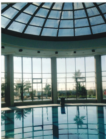
● Бассейн в г. Сочи