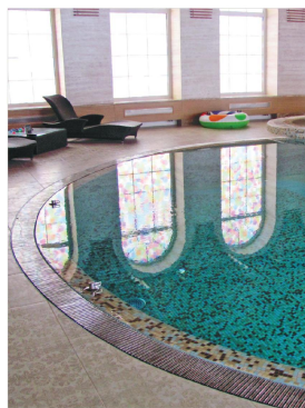
● Бассейн в г. Сочи.